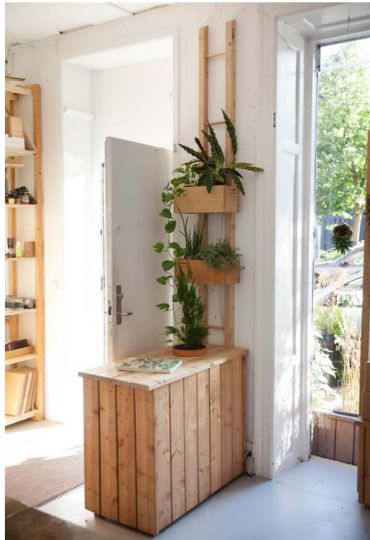
Køkkenkasse på møbel med stativ og selvvandende pumpeystem.