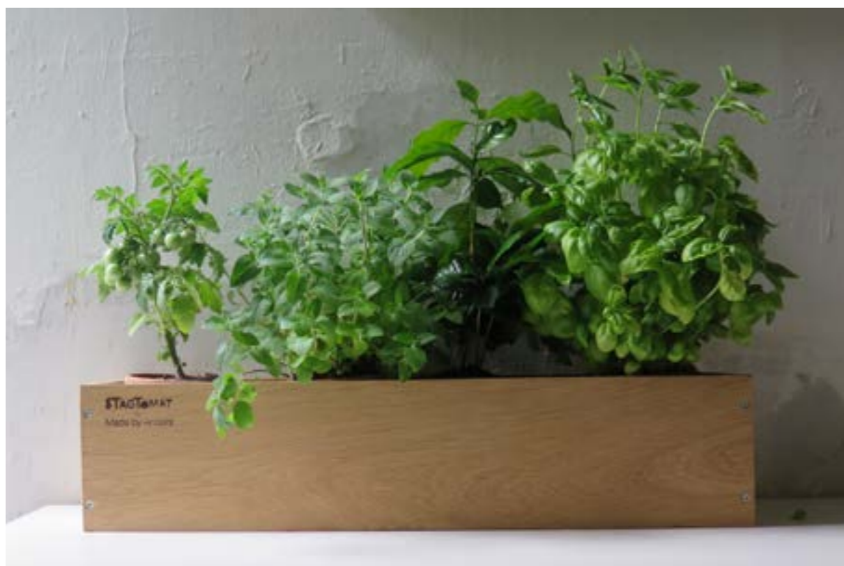
Køkkenkasse med: tomater, mynte og basilikum.